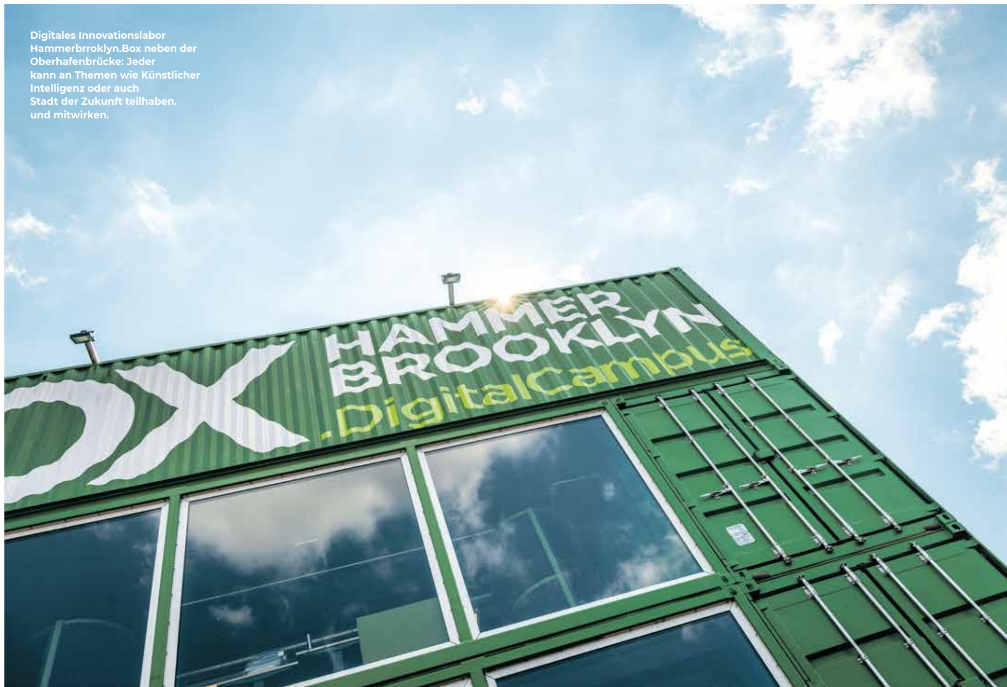
Digitales Innovationslabor Hammerbrooklyn.Box neben der Oberhafenbrücke: Jeder kann an Themen wie Künstlicher Intelligenz oder auch Stadt der Zukunft teilhaben und mitwirken.