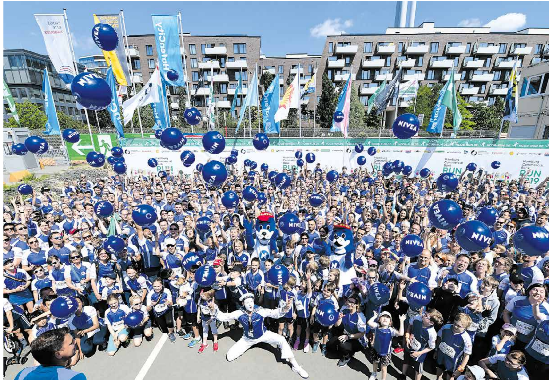
Es lachte nicht nur die Sonne – das Team der Beiersdorf AG stellte mit mehr als 900 Aktiven auch dieses Jahr das größte Team beim Hamburg Commercial Bank Run.