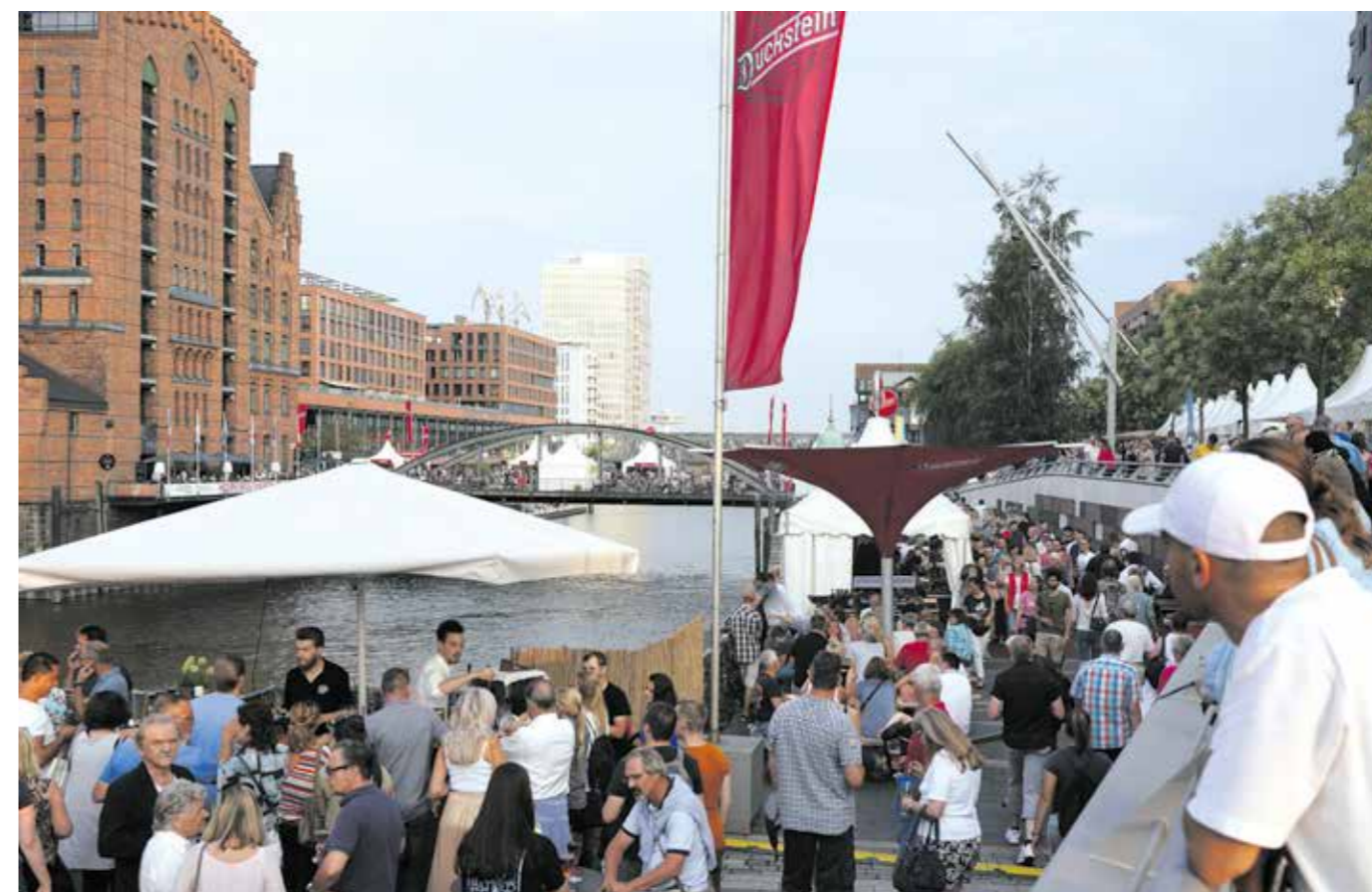
Umsonst und draußen: Das Duckstein-Festival feiert 5-jähriges Jubiläum in der Hafencity. THOMAS HAMPEL