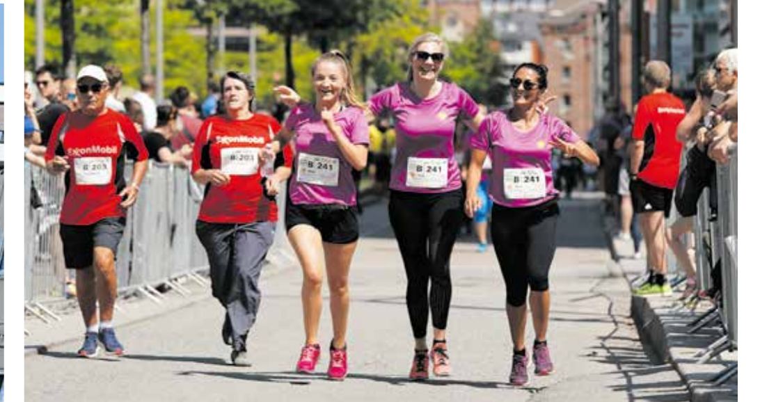
Bestens gelaunt werden die Teilnehmer nach vier Kilometern begeistert im Ziel empfangen.

Mit Arbeitskollegen, dem Chef und Freunden gemeinsam auf die Laufstrecke gehen, ohne Wettkampfstress, sondern für den guten Zweck: Das ist auch nach der Umbenennung in Hamburg Commercial Bank Run die Grundidee. Ende Juni kamen wieder Tausende in die Hafencity, um zugunsten von „Kinder helfen Kindern“ vier Kilometer durch Hamburgs jüngsten und rasant wachsenden Stadtteil zu laufen.