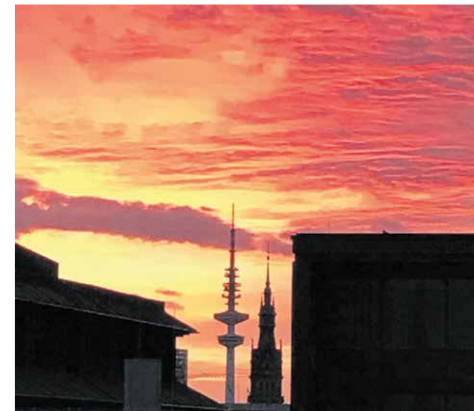
Himmel über der Hafencity