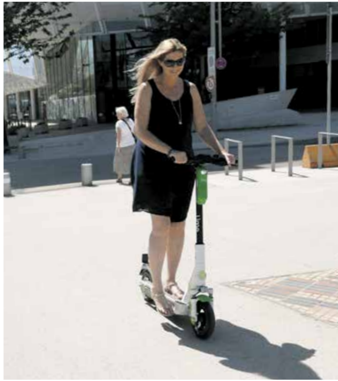
Lime-Scooter in der E-Roller-Hochburg Hafencity. WOLFGANG THOME

Nun rollen sie in der Hafencity: Nachdem Mitte Juni die Zulassungsverordnung für Elektro-Tretroller in Kraft getreten ist, haben Sharing-Anbieter ihr Angebot in Hamburg gestartet.