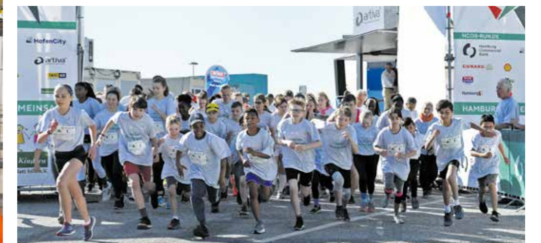
Traditionell eröffnet das Team „Kids in die Clubs“ auch den Hamburg Commercial Bank Run 2019.