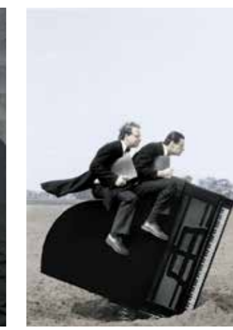
Musik-Comedy mit Stenzel & Kivitz.