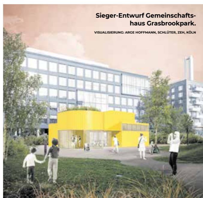
Sieger-Entwurf Gemeinschaftshaus Grasbrookpark.

Die Gemeinschaftshäuser sind seit Beginn der Außenraumplanung Teil der Parkkonzepte. Die Häuser erweitern die Nutzungsmöglichkeiten der Parks in der Hafencity enorm. Nur ganz wenige Parks bieten eine so enge Verknüpfung der Wohnerschaft mit den jewei-