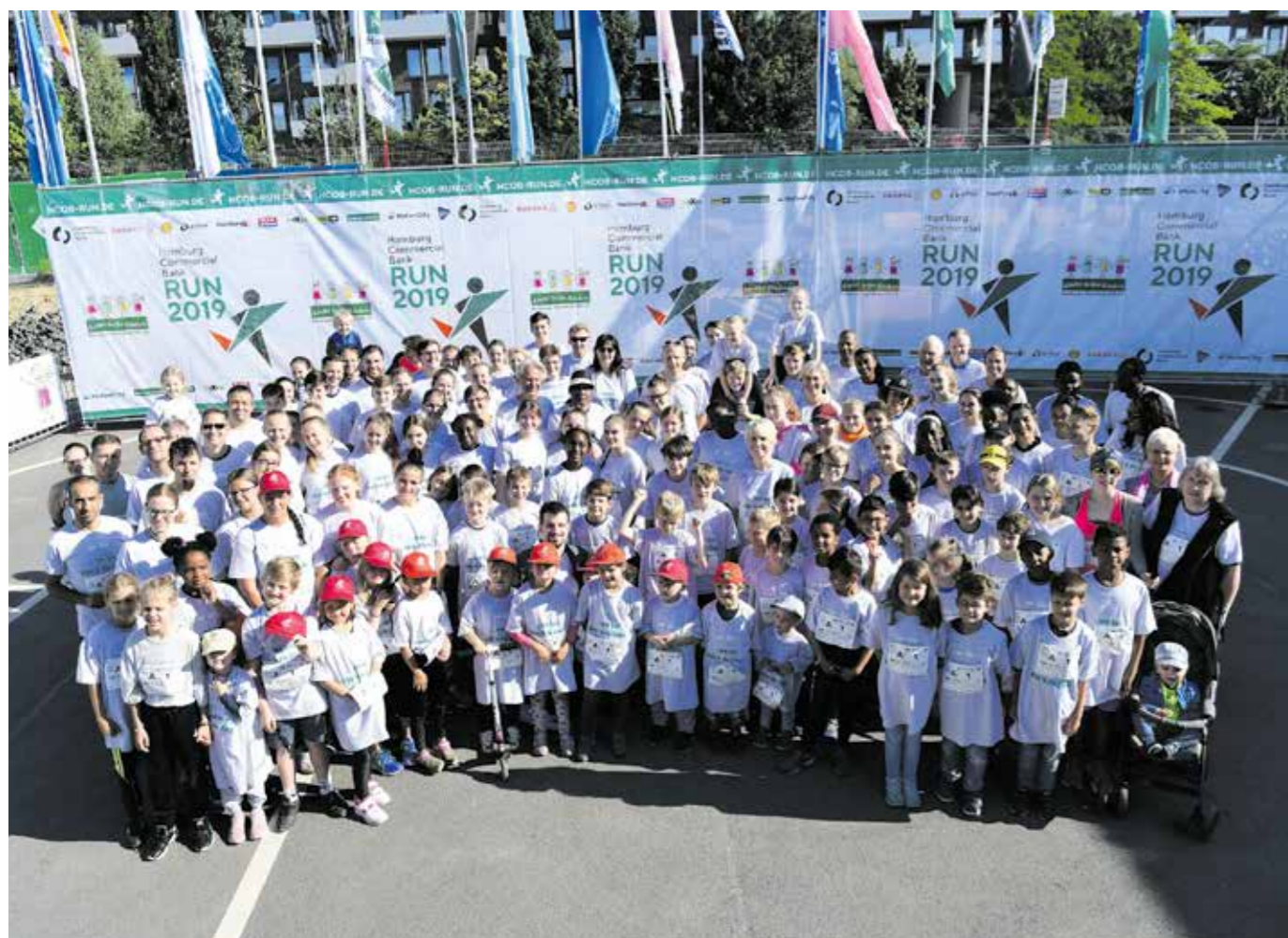
Das „Kids in die Clubs“-Team mit seinen mehr als 300 Kindern und Jugendlichen vorm Start am Cruise Center Hafencity.

* Gesamtspendensumme bei seiner achtzehnten Auflage