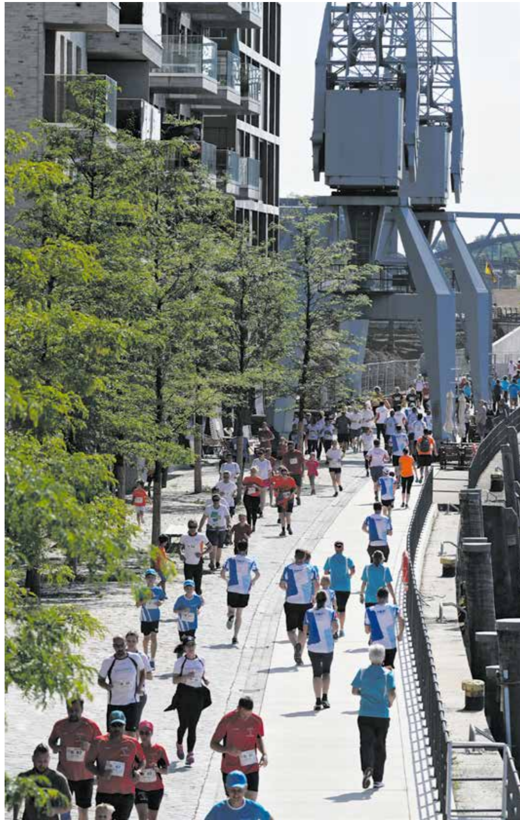
Sportliches Sightseeing bei Traumwetter entlang der Uferpromenade am Baakenhafen.

Der Hamburg Commercial Bank Run 2019 in der Hafencity war ein Riesenerfolg und führte in die jüngsten Quartiere des rasant wachsenden Stadtteils