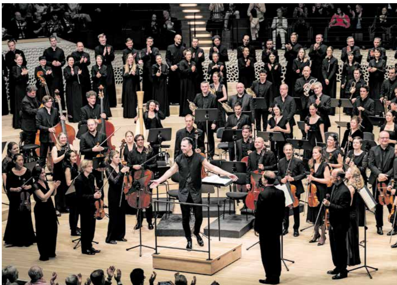
Röhrenjeans und Muskel-Shirt: Klangmagier aus dem Ural, Teodor Currentzis, und das Orchester wurden gefeiert.

KLASSIK BEGEISTERT: Der griechische Stardirigent Teodor Currentzis hat die Elbphilharmonie verstanden