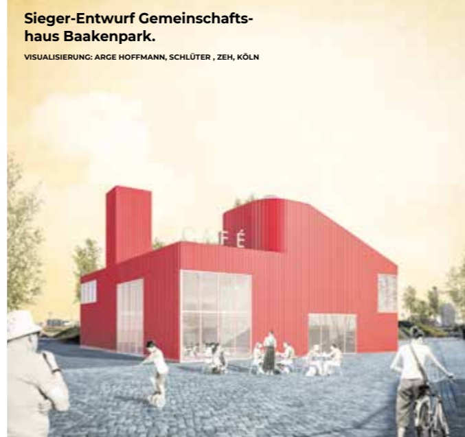
Sieger-Entwurf Gemeinschaftshaus Baakenpark.