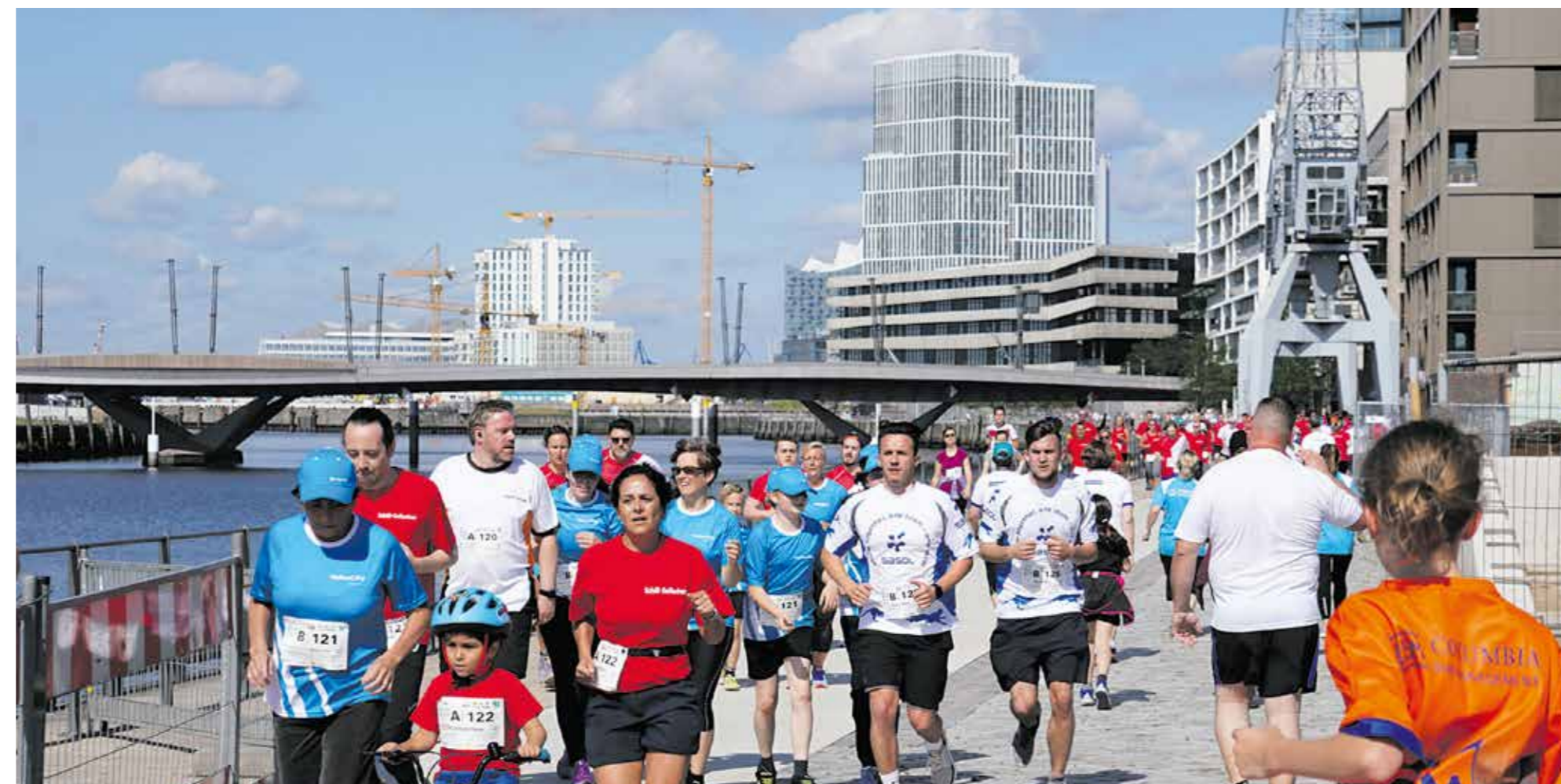
Neuer Name, neue Quartiere: Der Charity-Run eröffnete neue Blicke auf die Hafencity mit Baakenhafenbrücke und dem Watermark-Hochhaus hinter der Hafencity-Uni.