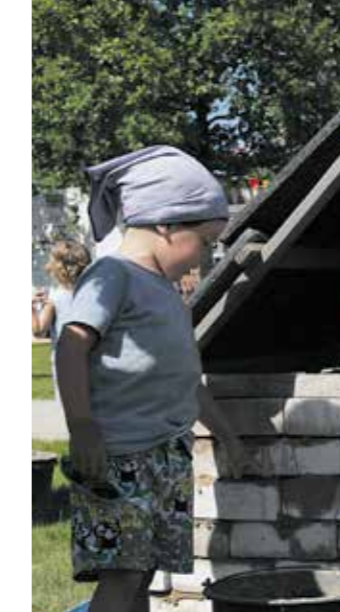
Der Lohsepark wird zur Kinderbaustelle BauTraum: Am So., 21. Juli und 25. August, jeweils von 13 bis 17.30 Uhr können sich die Kleinen als Bauherren, Architekten, Künstler und Bauarbeiter erproben – alles unter fachlicher Anleitung.