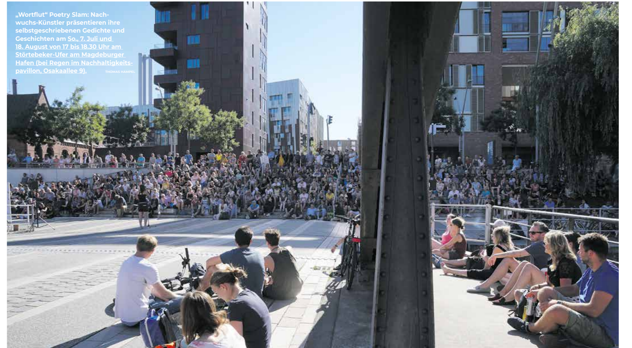
„Wortflut“ Poetry Slam: Nachwuchs-Künstler präsentieren ihre selbstgeschriebenen Gedichte und Geschichten am So., 7. Juli und 18. August von 17 bis 19.30 Uhr am Störtebeker-Ufer am Magdeburger Hafen (bei Regen im Nachhaltigkeitspavillon, Osakaallee 9).

THAI HAU Massage und Spa Shanghaiallee 10 20457 Hamburg www.thaihou.de