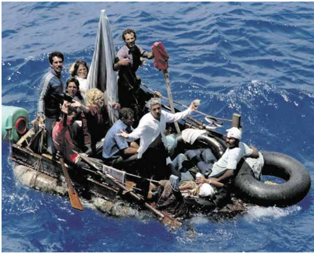
Kubanische Bootsflüchtlinge, auf dem Weg von Kuba nach Florida in den USA.