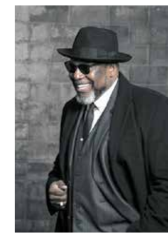
Blues- und Soulabend mit Big Daddy Wilson. PR/DUCKSTEIN-FESTIVAL