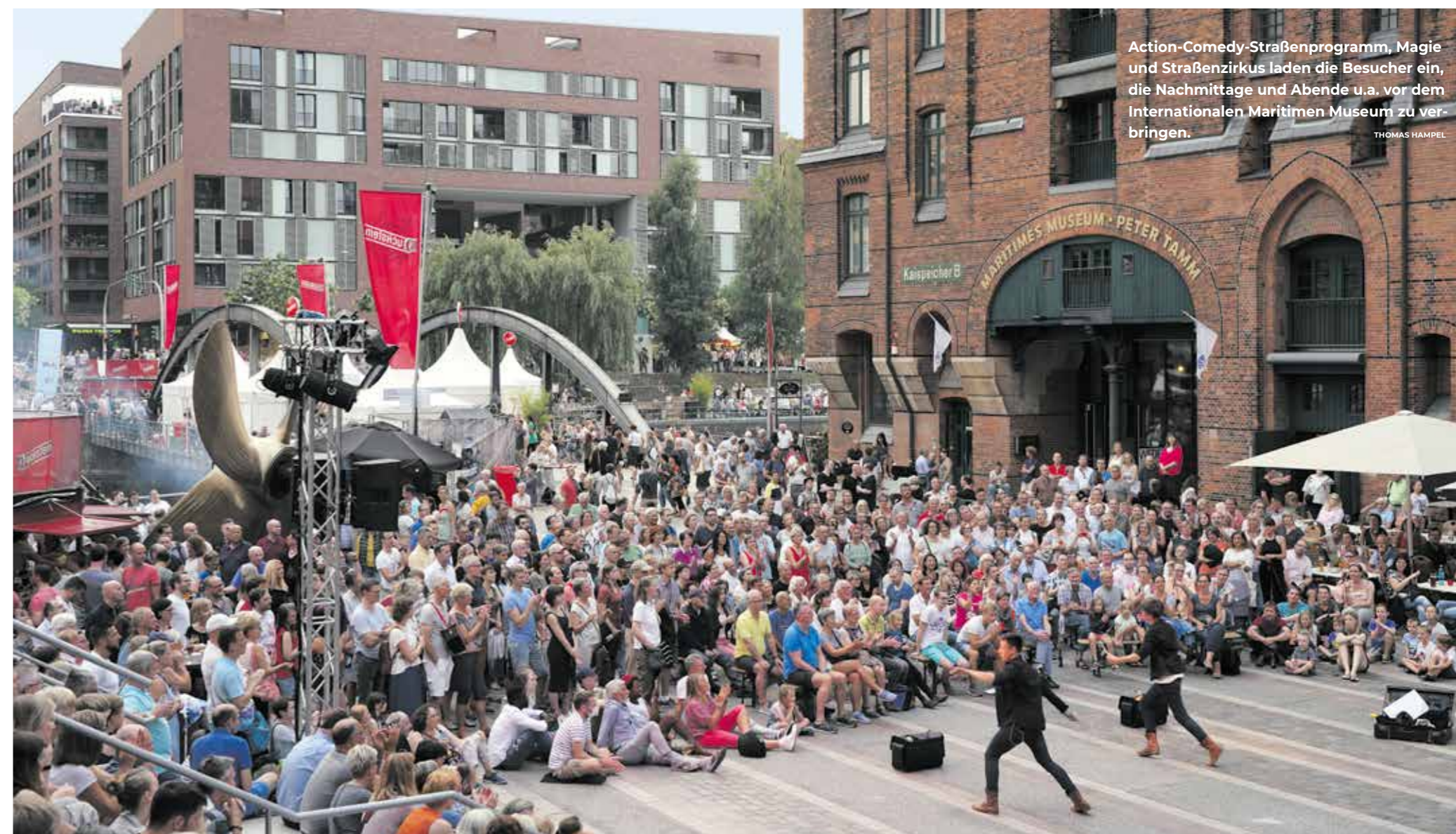
Action-Comedy-Straßenprogramm, Magie und Straßenzirkus laden die Besucher ein, die Nachmittage und Abende u.a. vor dem Internationalen Maritimen Museum zu verbringen. THOMAS HAMPEL