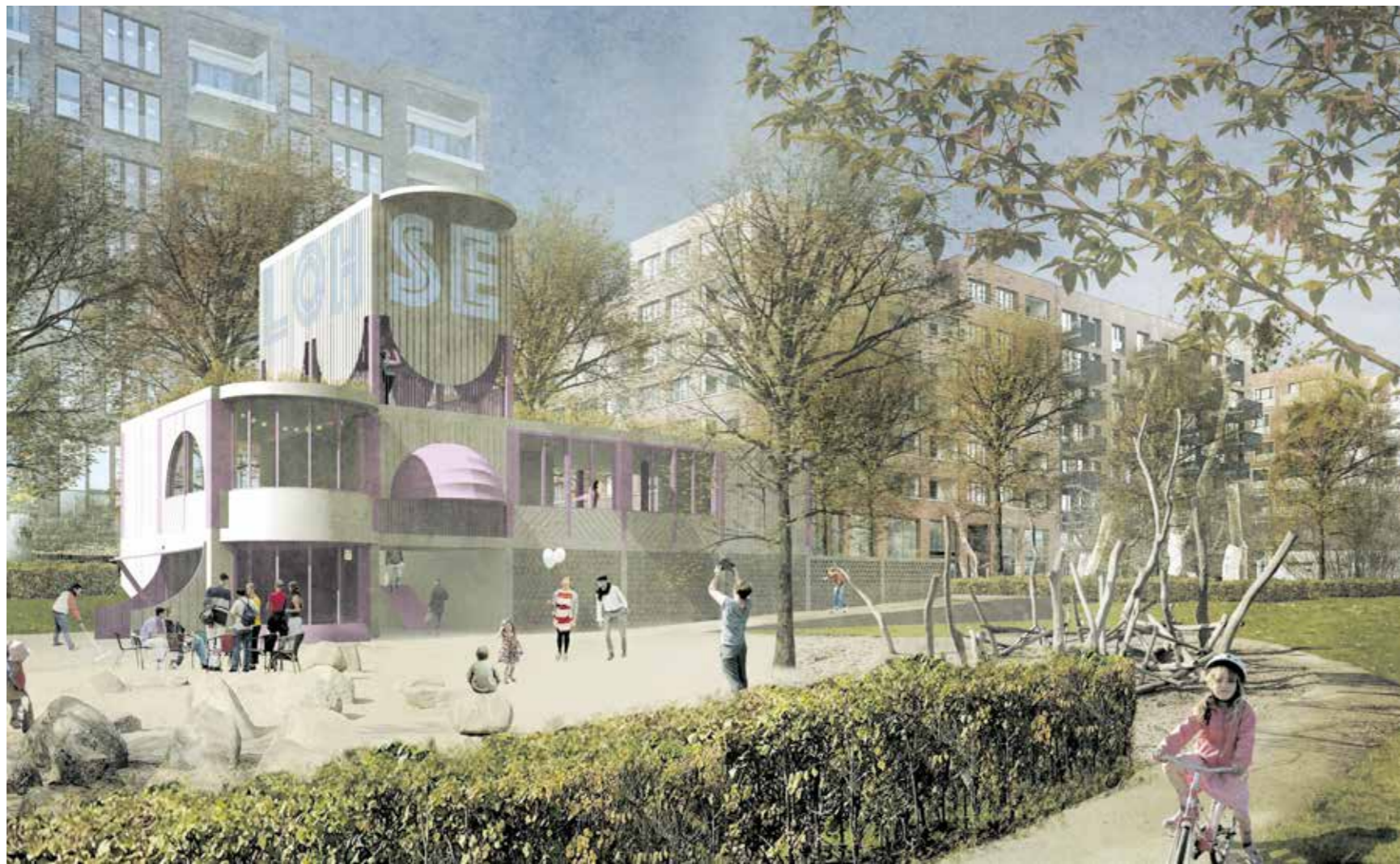
Neue Erlebniswelt, Tagungsräume und Nachbarschaftskultur: Sieger-Entwurf Gemeinschaftshaus Lohsepark.

Die Entwicklung der ersten Ideen und Konzepte ist immer der spannendste Moment im Büro. Wir haben kein Grundrezept, wie wir die Entwürfe angehen. Bei jedem Projekt sitzen wir wieder vor dem gleichen leeren