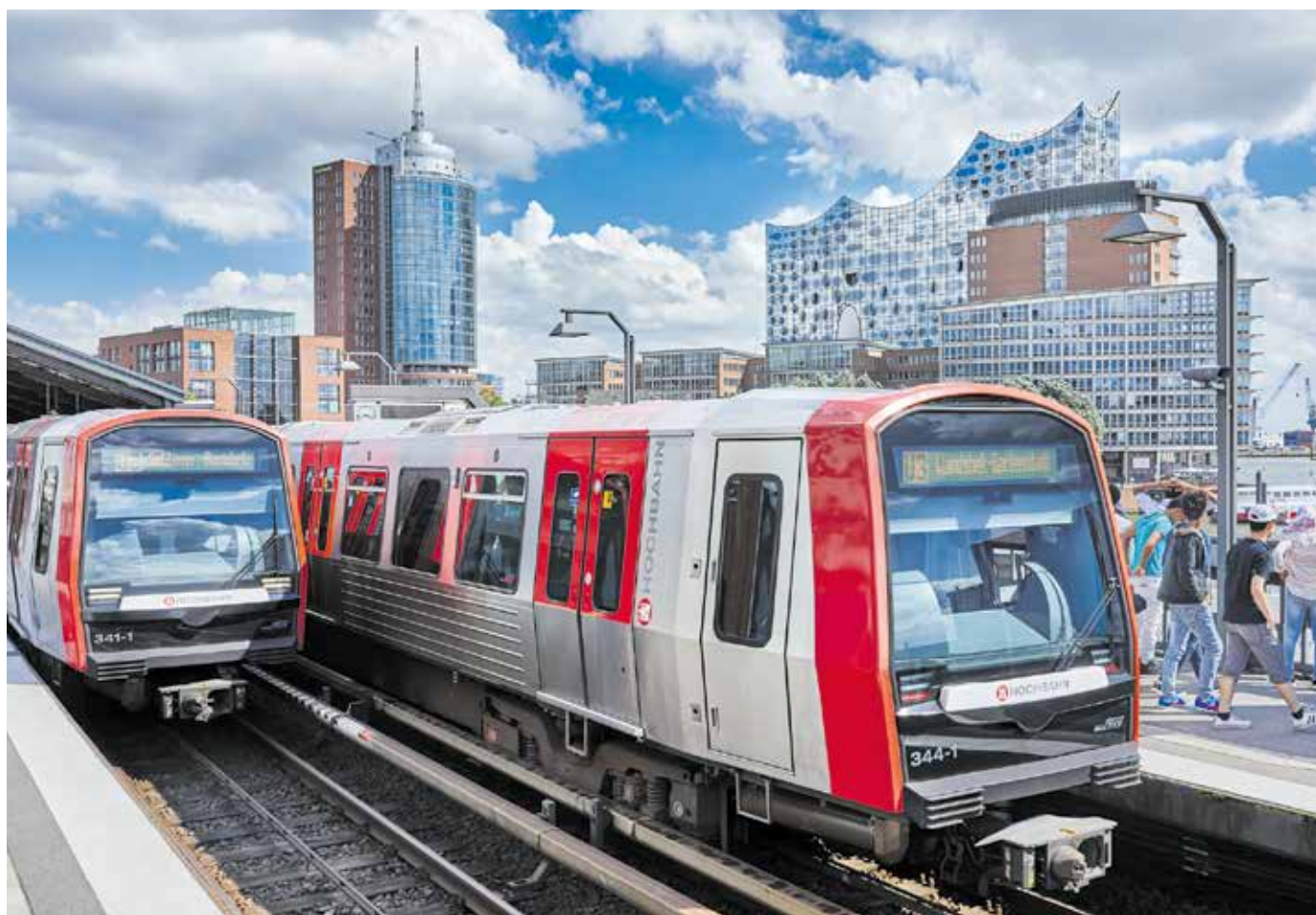
Neue U-Bahn-Generation: Die Züge des Modells DT 5 verfügen über Wagen-Durchgänge, große Infobildschirme und USB-Ladebuchsen. Das Verkehrsunternehmen will weitere 32 Fahrzeuge nachordern und die Flotte auf 163 aufstocken.

Öffi-Offensive: Mit Bus, U- und S-Bahn sollen alle Fahrgäste im neuen „Hamburg-Takt“ ihre Ziele pünktlicher erreichen