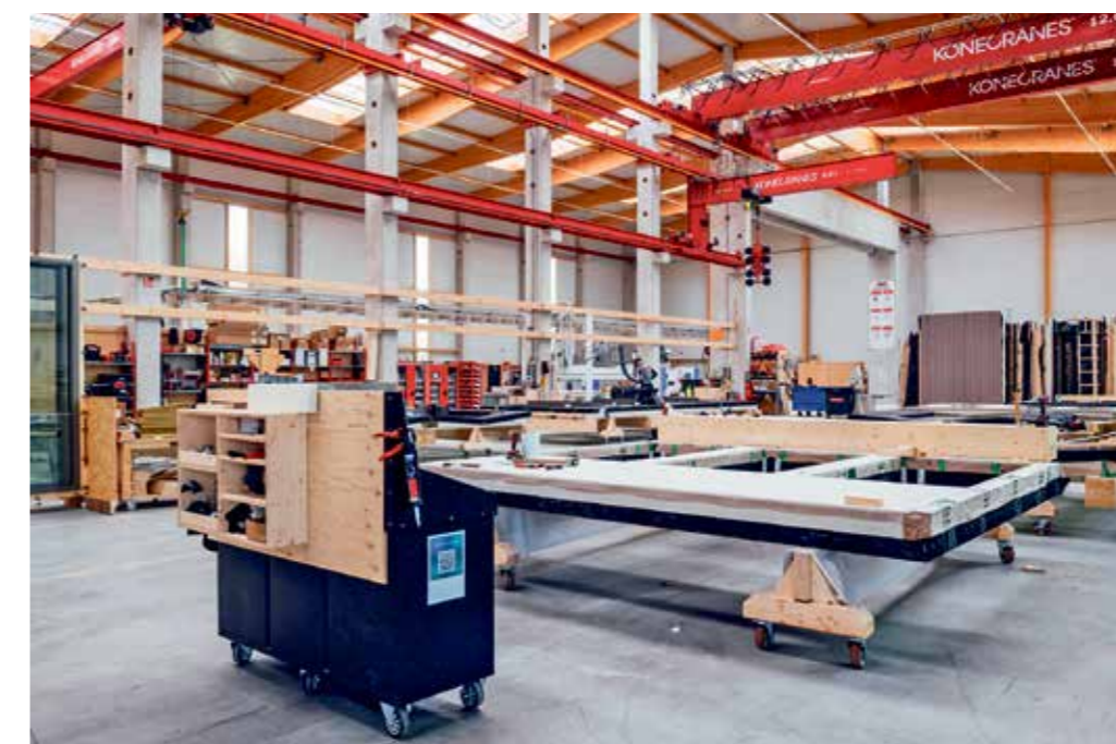
Serielle Produktion. Bei einem Holzunternehmen im Münsterland entstehen Wand- und Fensterelemente. Holzlagen werden zusammengesetzt, Fenster im Werk eingesetzt, Fensterbretter montiert – und am Ende für den Transport nach Hamburg vorbereitet.

Das Gebäude entsteht neben dem Heizkraftwerk im Kreuzungsbereich San-Francisco-Straße/Am Dalmannkai. Für die HCH ein Vorzeigeprojekt nachhaltigen Bauens: „Die Fassade und das Dach werden großflächig begrünt. Nicht zuletzt wird das Gebäude keine Pkw-Stellplätze vorhalten, stattdessen setzt das Null-Emissionshaus in unmittelbarer Nachbarschaft zur U-Bahn-Station Überseequartier und mit bis zu 150 Fahrrad-Stellplätzen Impulse für eine umweltfreundliche Mobilität.“