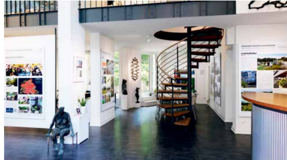
Eingangsraum des Forums StadtLandKunst