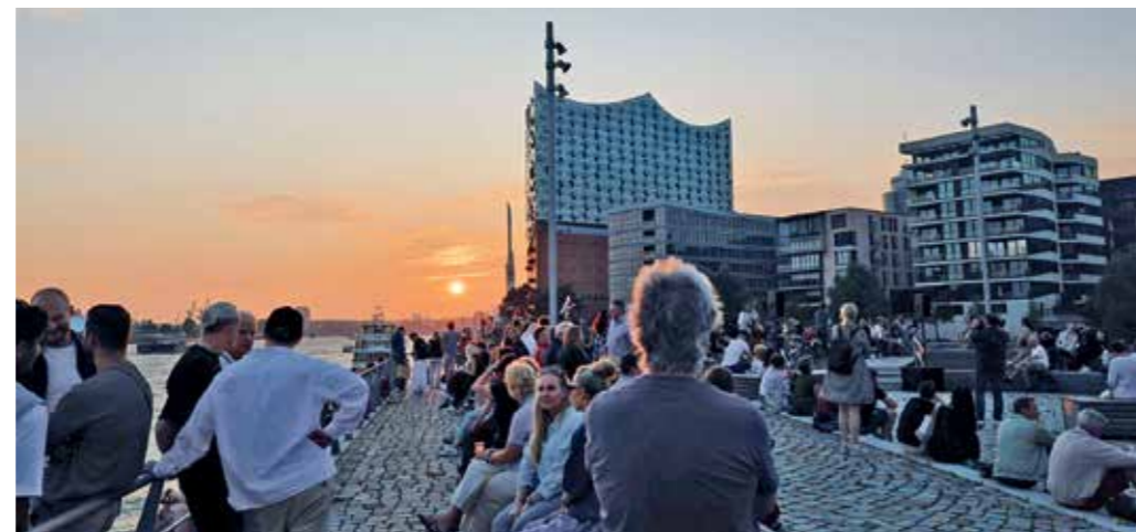
Sunset Sound auf dem Strandhöft: Jazzbands und Singer-Songwriter-Konzerte.

werden die elbnahen Stadtgebiete großflächig und vielfältig bespielt. Alle Termine finden Sie unter: elbsommer.com/veranstaltungen