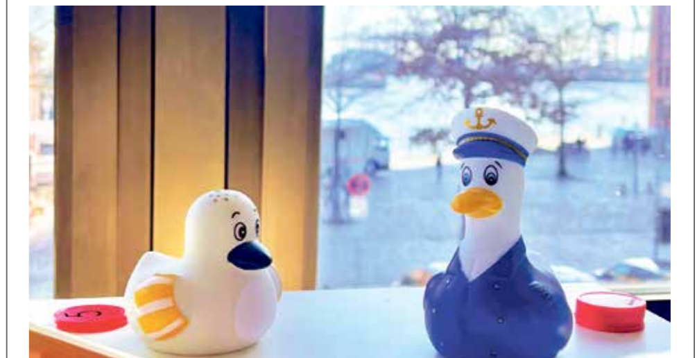
Inhalte werden in einem neuen Rahmen ausprobiert.