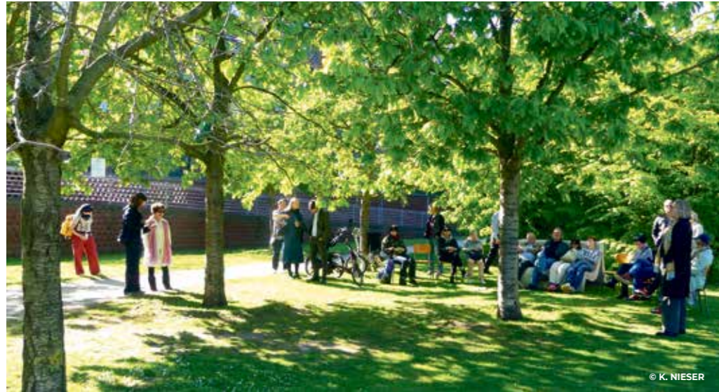
Ankommen der Gäste im Lohsepark zur Installation »Parlament der Bäume« von Julia Nordholz.

Klima. Die Ausstellung »Zwischen Pflaster und Baumkrone« der Stiftung StadtLandKunst findet im Forum StadtLandKunst im Rahmen des 11. Hamburger Architektur Sommers statt