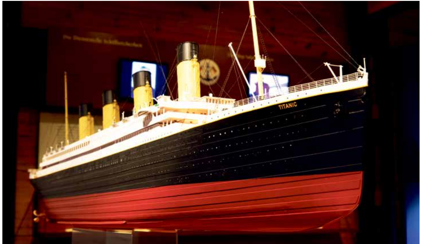
Ihr Untergang war der Startschuss für mehr Sicherheit auf See: die R.M.S. „Titanic“.

Die Deutsche Gesellschaft zur Rettung Schiffbrüchiger (DGzRS) finanziert sich zu 100 Prozent durch Spenden. Das älteste noch in Nutzung befindliche „Spendenschiffchen“ von 1875 steht im IMMH. imm-hamburg.de