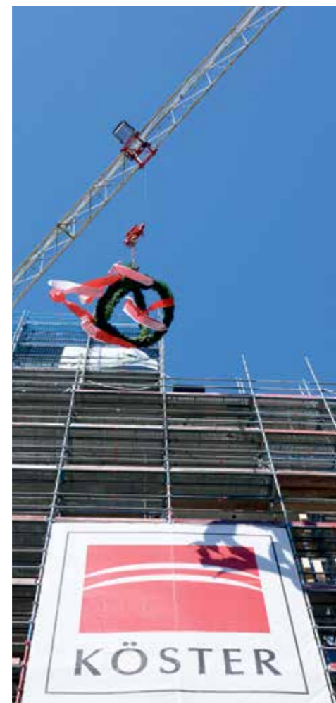
Rot-weiße Flatterbänder signalisieren Bauunternehmer und Bauherrn: Der Rohbau ist übergeben.