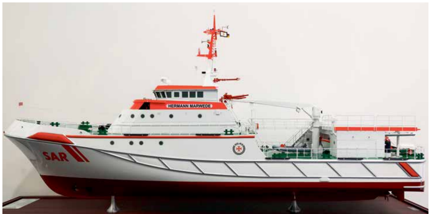
Neuer Heimathafen in der U-Bahn-Station „Überseequartier“: Modell des Seenotrettungskreuzers „Hermann Marwede“.