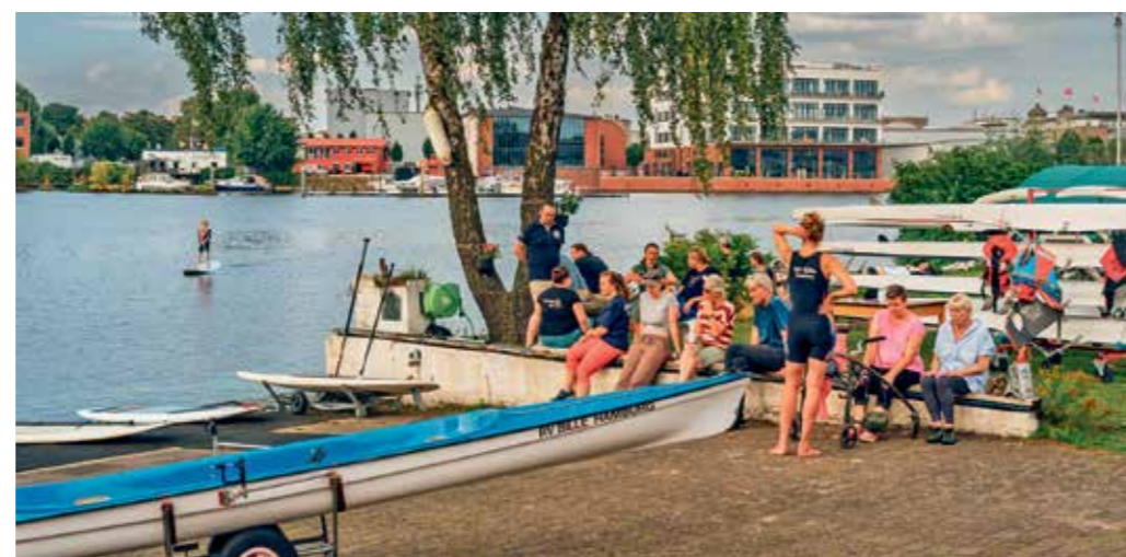
Sommerfest beim RV Bille: Rudern und Paddeln in Rothenburgsort.

Mit der Veranstaltung » Auf die Plätze « lädt die HafenCity GmbH in diesem Jahr dazu ein, die östliche HafenCity neu zu erleben. Rund um die Namensgeberinnen der Plätze im Baakenhafen entsteht ein abwechslungsreiches Programm, das zum Entdecken und Verweilen einlädt. Durch das PARKS, Bullerdeich 6, als Veranstaltungsort des NaJe Festivals erweitert sich das elbsommer -Gebiet erneut ein wenig durch den Sprung über die Bille. Von Veranstaltungen auf dem Strandhöft bis hin zur Elbinsel Kältehofo