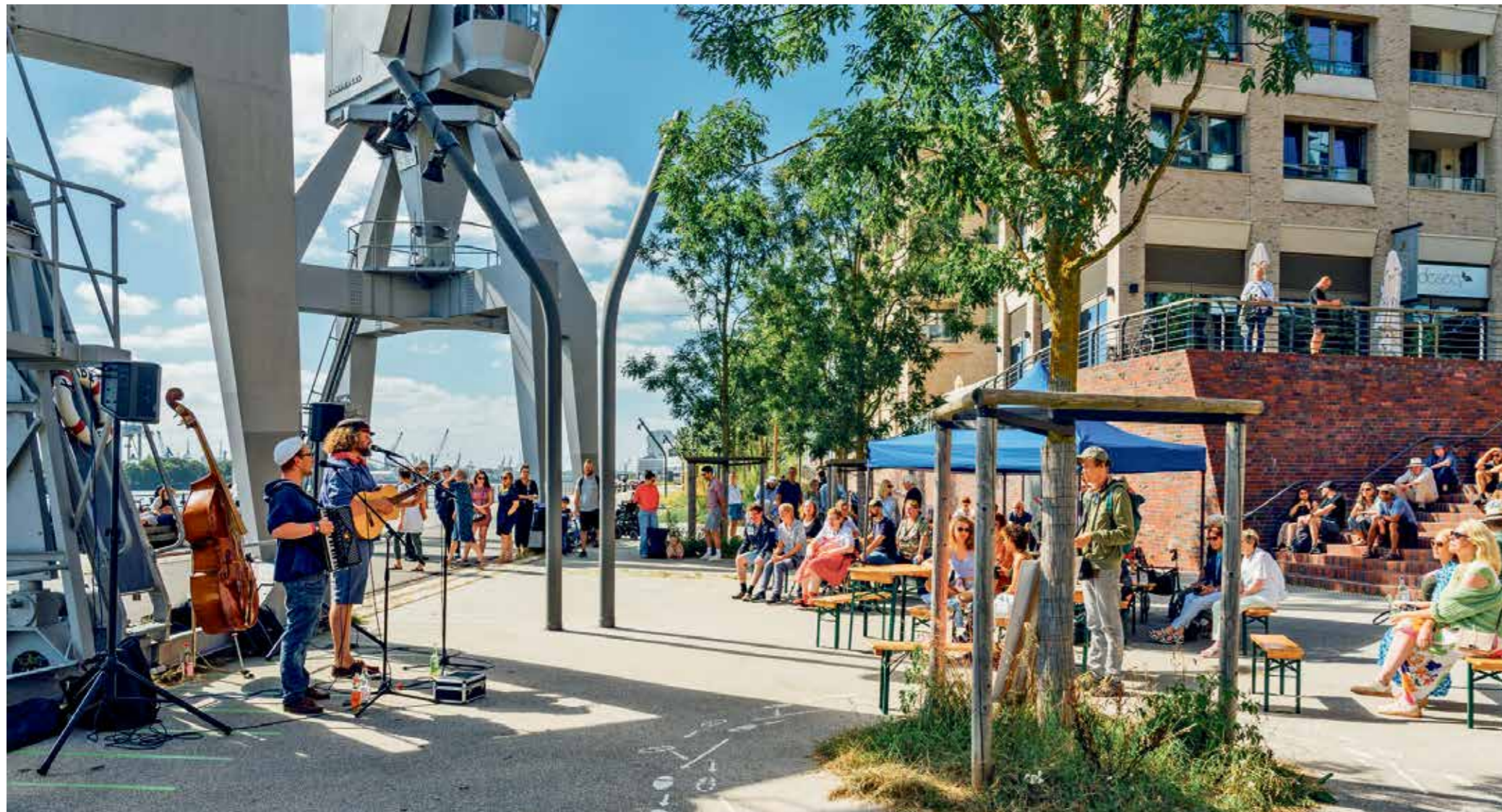
Das Concert meets Elbe -Event findet wieder direkt an der Norderelbe auf der Promenade des Kirchenpauerkais und zu Füßen des Lola-Rogge-Platzes statt.

Event. Die Veranstaltungsreihe » elbsommer « der HafenCity Hamburg GmbH findet noch bis 31. August mit 33 Partnern an neuen und bewährten Orten und Plätzen der HafenCity statt. Neben Tanzen, Singen und Poetry-Slam finden beim elbsommer -Partner Überseequartier Nord auch wieder die Angebote Fotosafari, Portrait-Workshop mit stern- Fotograf Oliver Hadji und Stand-up-Comedy auf dem Überseeboulevard statt