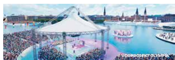
Olympia? Nein. Hamburg will keine Spiele ausrichten.

Was bleibt? Die Leader der Pro-Olympia Kampagne, Bürgermeister, Wirtschaftsführer, Initiativen und Sponsoren konnten erstens emotional nicht genug Fans hinter sich versammeln. Wer zweitens am lautesten populistische Parolen wie Die Linke, AfD und NOlympia brüllt, bekommt die Schlagzeilen und verwandelt mit Copy-and-Paste-NOlympia-Kommentaren positive Olympia-Posts in Anti-Olympia-Foren. Das Referendum dokumentiert auch die zunehmende Spaltung der Stadtgesellschaft und zwingt Politik, Wirtschaft und Gesellschaft dazu, Menschen erfolgreicher zu verbinden – mit authentischer Emotionalität.