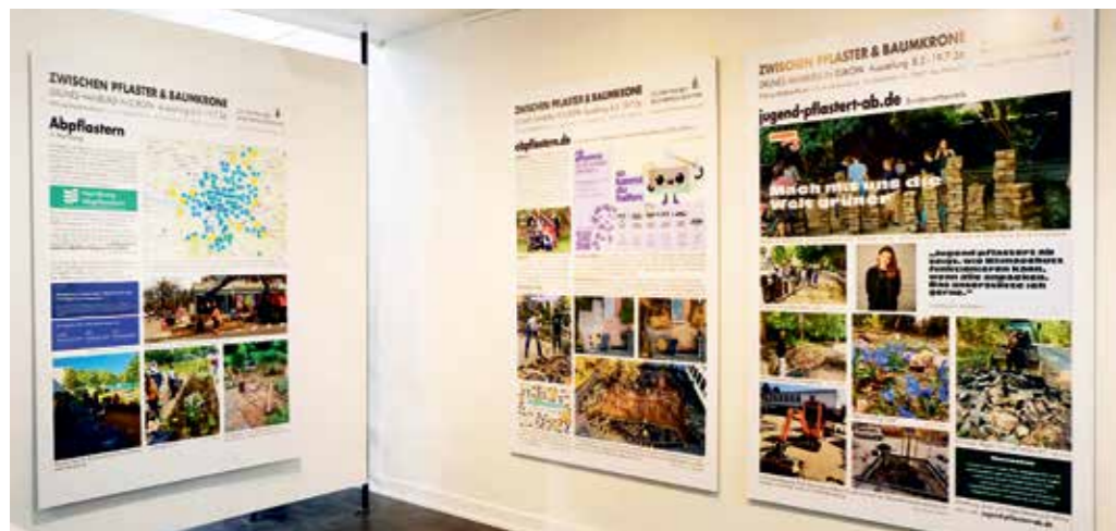
Ausstellungstafeln der drei »Abpfastern«-Initiativen.