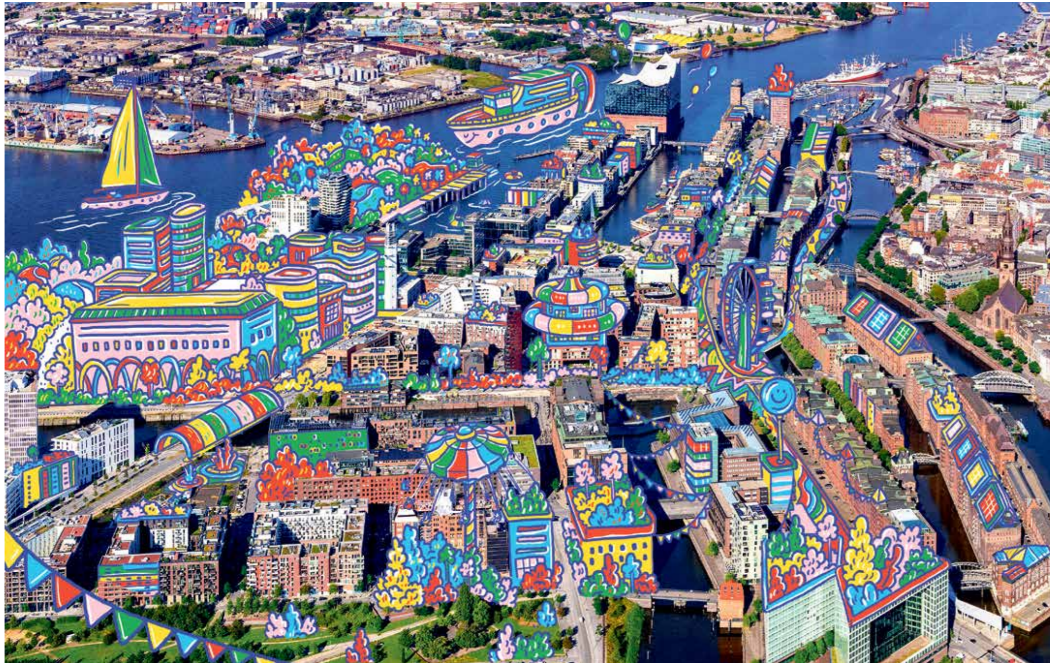
Das Fantasie-Wimmelbild der Hafencity aus der Grafikwerkstatt des Nice Idea Clubs. Gründer Gilg Frick: „Kreativität ist aber nicht vernünftig. Die besten Ideen entstehen unter der Dusche, nicht auf Knopfdruck. Kreativität lässt sich oft nur dann blicken, wenn man sie am wenigsten erwartet – und ganz selten dann, wenn man sie dringend braucht.“ © ILLUSTRATION: NICE IDEA CLUB

Essay. Der Nice Idea Club in der Kobestraße am Lohsepark lud mit Gründer Gilg »Gilgius« Frick zu einem lässigen Afterwork mit Vortrag ein. Motto: »Mut zur Kreativität«