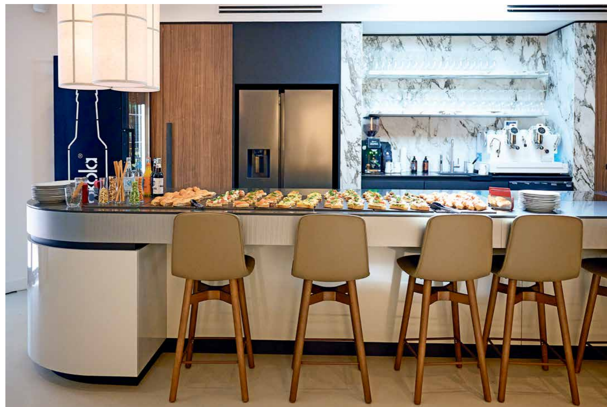
Luxus 2026 im Community-Wohnobjekt »Eleven Decks«: „Es spielen nach amerikanischem Vorbild Services wie Concierges, digitale Community-Apps und bewirtschaftete Gemeinschaftszonen wie Clubhouse-Flächen, Co-Working-Spaces oder Fitness-Erlebniswelten eine immer größere Rolle. Immer wichtiger werden für die Bewohner einer Premiumimmobilie auch gemeinsam zu nutzende Außen- oder Dachterrassen – sei es für Hausveranstaltungen oder private Events.“