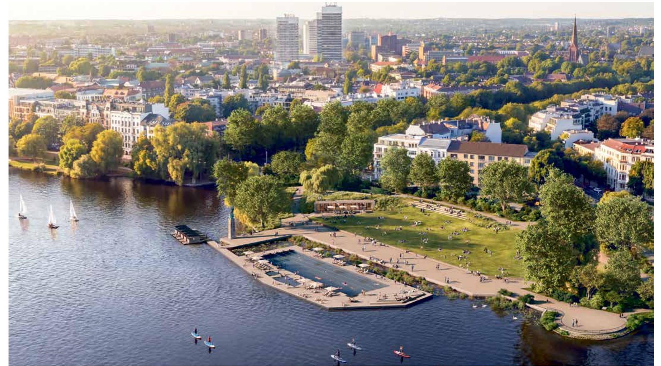
Umweltsenatorin Katharina Fegebank zum »Freibad Schwanenwik«: „Ich hoffe, dass der Entwurf auch bei Ihnen die eine oder andere Fantasie beflügelt, hier künftig wirklich zu schwimmen und ins Wasser zu springen.“

Info I Mehr Informationen zur Gewerbevertretung IGH im Netzwerk Hafencity e.V. unter: netzwerk-hafencity.de/igh Info II Mehr Informationen zu B & O: bang-olufsen.com/de