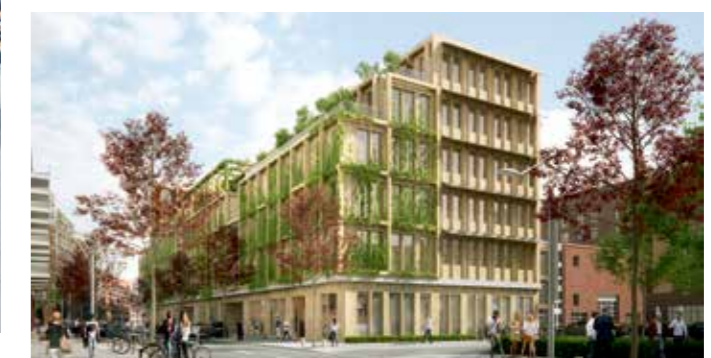
Das Null-Emissionshaus, künftiger Firmensitz der HafenCity Hamburg GmbH. © VISUALISIERUNG: HEINLE WISCHER UND PARTNER