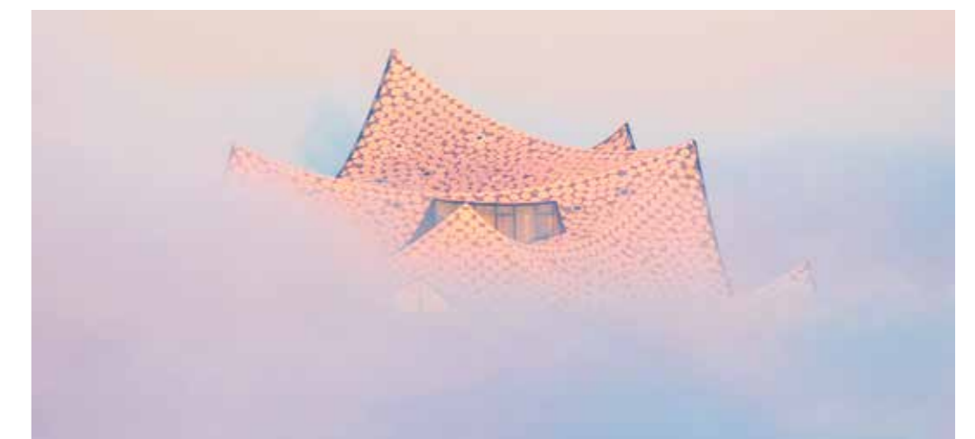
Foto-Wettbewerb-Gewinner 2025, Nils Steiner: Elbphilharmonie im Morgennebel. © NILS STEINER