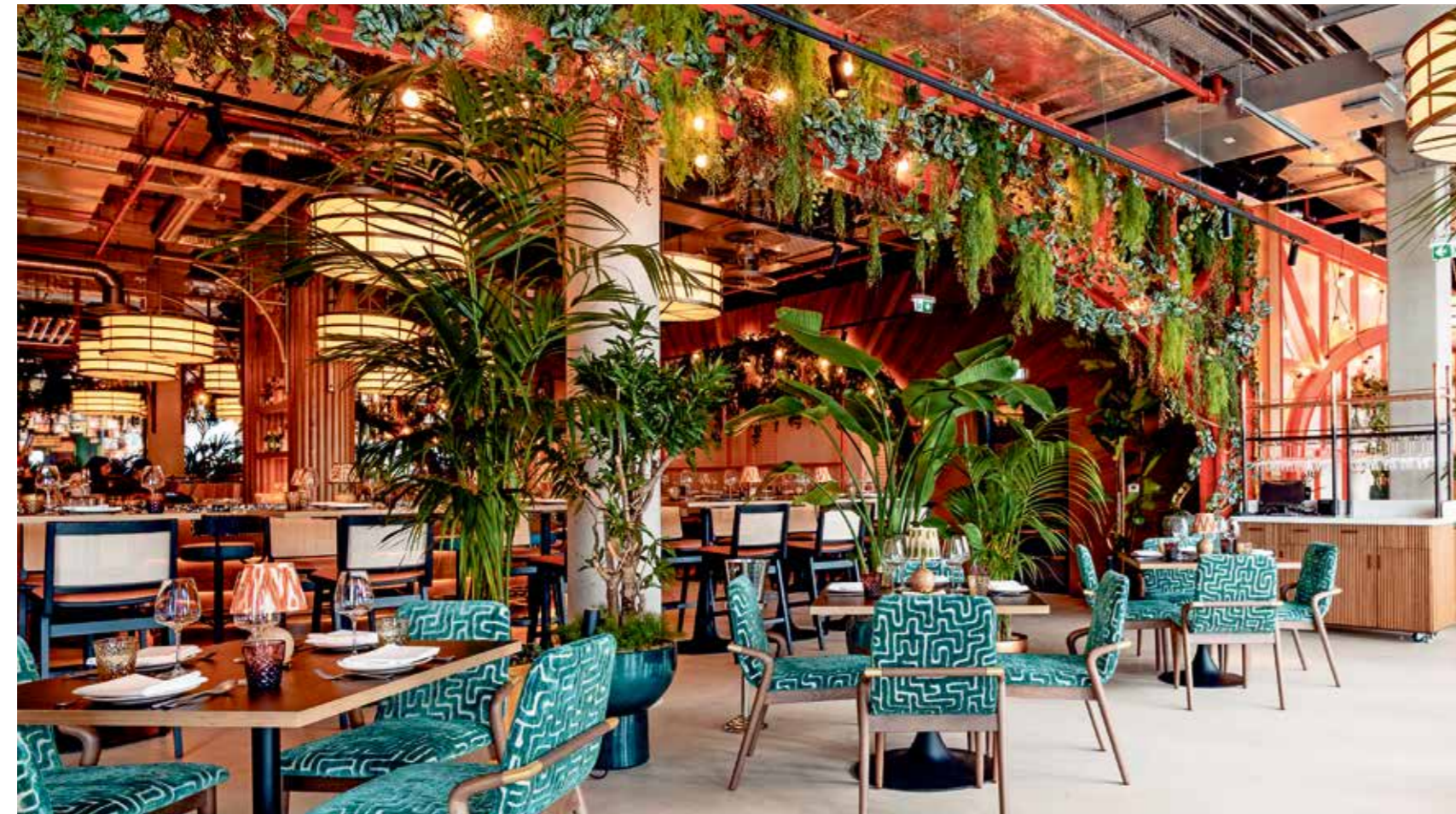
Das neue lateinamerikanische Restaurant Elemente im Westfield-Überseequartier – ab Sommer mit Rooftopbar AirBar13.

Für mich ist klar, mit der weißen Bimmelbahn ist die HafenCity frisch aus ihrem Dornröschenschlaf mit den viel zu vielen roten und blauen Hop-on- und Hop-off-Bussen erwacht. Nicht durch gigantische Prestigeprojekte