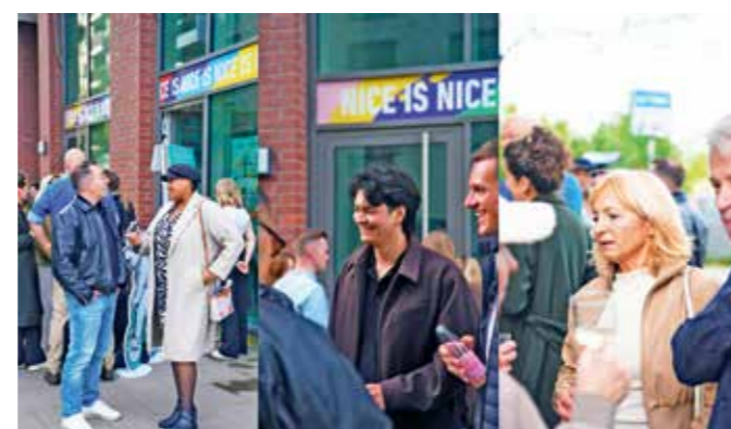
Afterwork-Netzwerken beim Mut zur Kreativität-Treffen im Nice Idea Club in der Kobestraße.