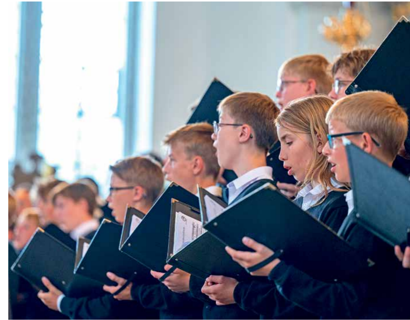
Farbenreiches Klangideal von Giachino Rossinis »Petite Messe solennelle« – für eine kleine Besetzung aus »zwölf Sängern der drei Geschlechter Männer, Frauen und Kastraten«.

Vorschau. Im Großen Saal der Elbphilharmonie führen am 12. Juli die Tölzer Sängerknaben mit erwachsenen Sängern Giachino Rossinis »Petite Messe solennelle« auf. Eine Klangmatinee