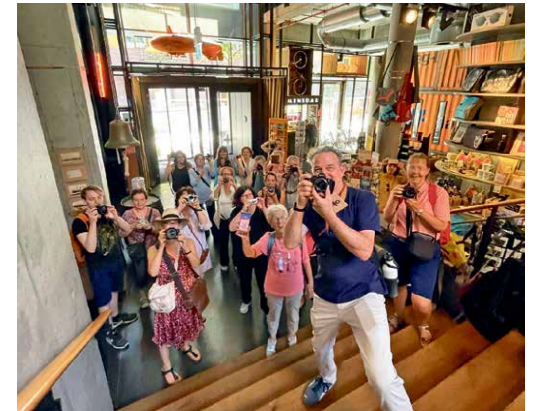
Fotosafari und Portrait-Workshop mit Starfotograf Oliver Hadji: hier 2025 auf Entdeckertour in der Thalia Buchhandlung im Überseequartier.