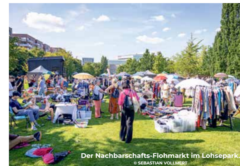
Der Nachbarschafts-Flohmarkt im Lohsepark.

Ein besonderes Highlight ist auch wieder der große Familienflohmarkt . Zwischen liebevoll aufgebauten Ständen kann gestöbert, gefeilscht und entdeckt werden – von Kinderkleidung und Spielzeug über Bücher und Haushaltsgegenstände bis hin zu kleinen Schätzen und