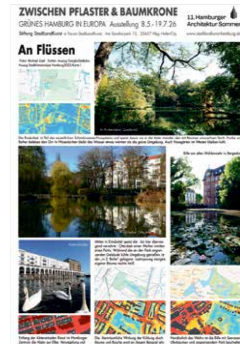
»An Flüssen«. Text: SLK.

»Zwischen Pflaster und Baumkrone«, Ausstellung der Stiftung StadtLandKunst im 11. Hamburger Architektur Sommer, bis 19. Juli im Forum StadtLandKunst Am Sandtorpark 12, 20457 Hamburg, www.stadtlandkunst-hamburg.de Geöffnet: Fr.–So., 12–18 Uhr, und nach V.