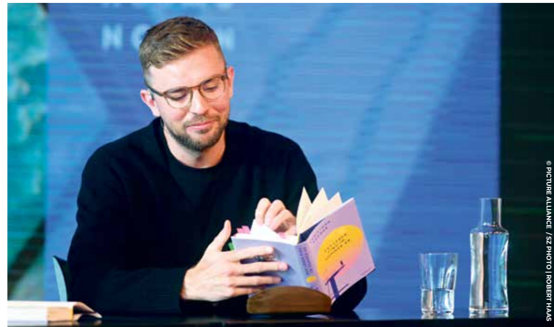
Lesung mit Fußballweltmeister Christoph Kramer und seinem Roman »Das Leben fing im Sommer an«: Sonnige Public-Viewing-Erlebnisse, die uns mitreißen. Und die uns gegen alles bessere Wissen glücklich machen können.