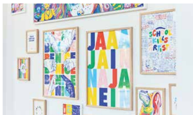
Plakative Pop-Motto-Kunst in der Nice Idea Gallery: „Jaaa, Jain, Naja, Nein!“

Info Mehr Informationen zum Nice Idea Club und dem NICE Campus mit Gallery, Store und Playground unter: niceideclub.earth