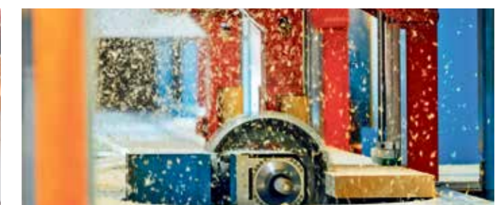
Zuschnitt der Holzelemente für die Fassade.