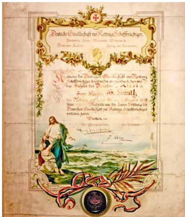
Ehrung für Kapitän Hinrich Knuth , der 1899 vor der chinesischen Küste zehn Schiffbrüchige rettete.