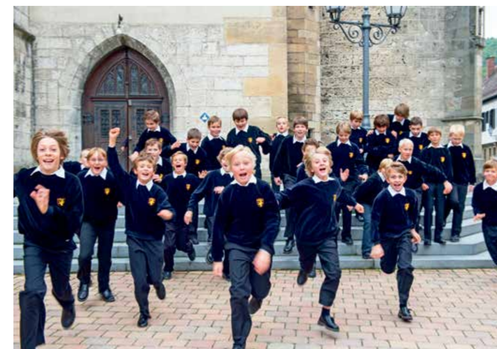
Der Tölzer Knabenchor zählt seit über 60 Jahren zu den gefragtesten Knabenchören der Welt und bestreitet mehr als 150 Auftritte im Jahr.