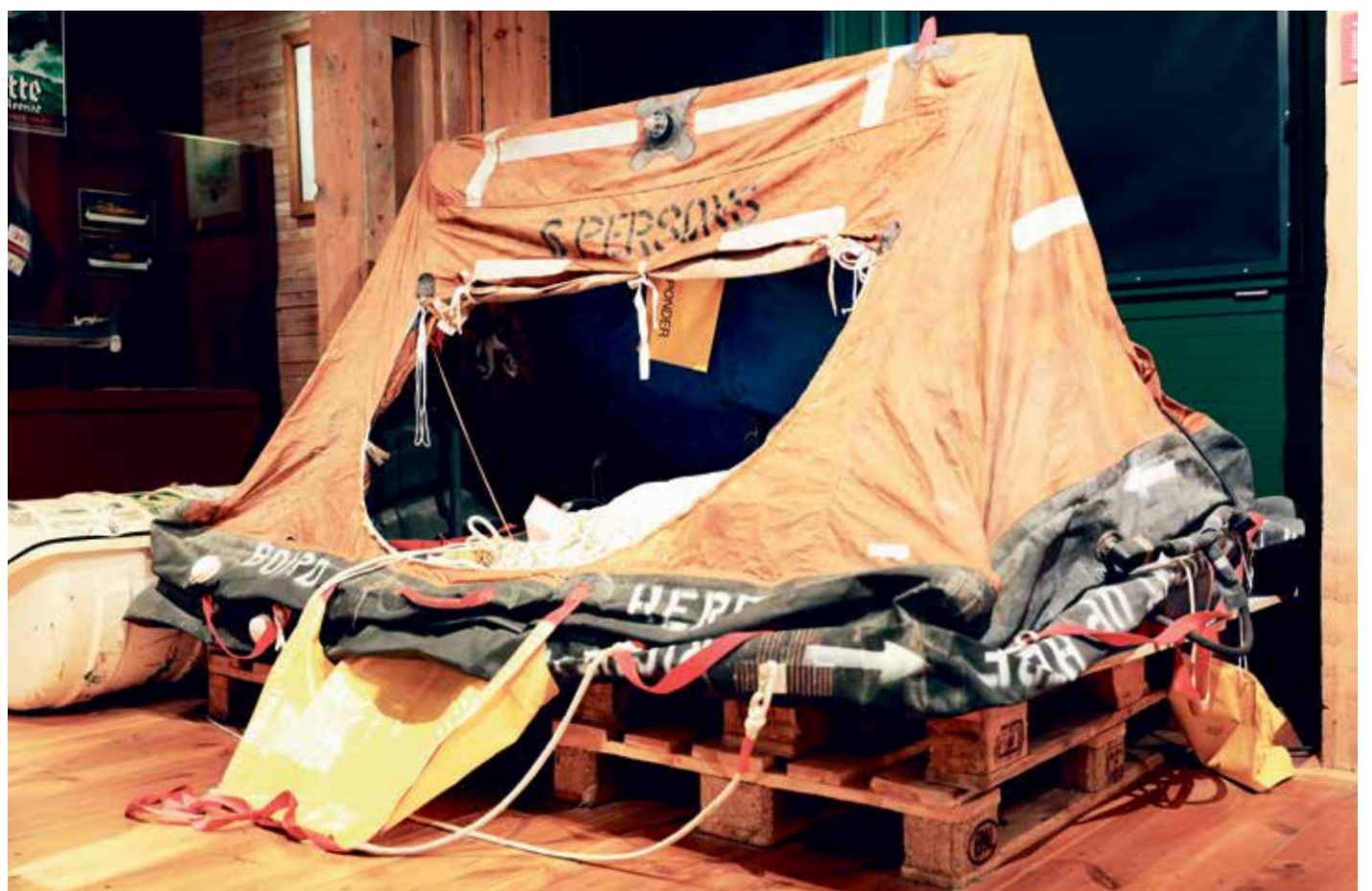
Notunterkunft mit Notrationen für sechs Personen: selbstaufblasende Rettungsinsel.