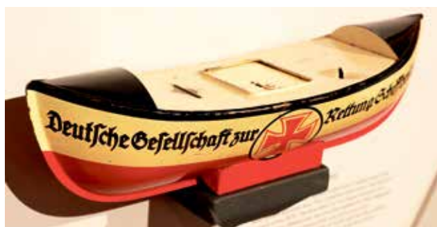
Seit 1875 im Einsatz: das älteste DGzRS-„Spendenschiffchen“.